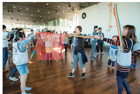
スカーフ、ボール、お皿など サーカス道具を使うワーク