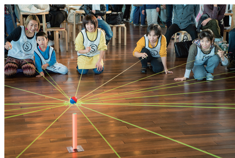
具を使って全員で1つのことを 成し遂げるワーク