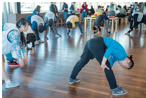
ストレッチで自分の身体を知るワーク

PROJECTの様々な分野の専門家や、多彩な団員たちが交代でファシリテーターを務めます。 どのような参加者が参加するかを確認しながらプログラムを組み立てるため、安心してご参加いただけます。