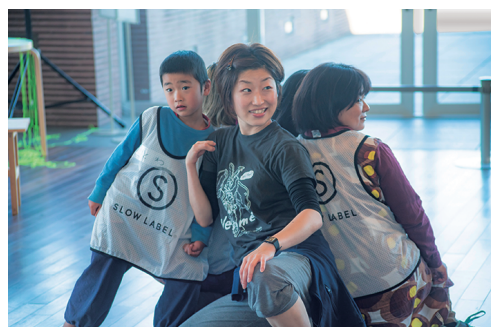
身体を使って コミュニケーションをとるワーク